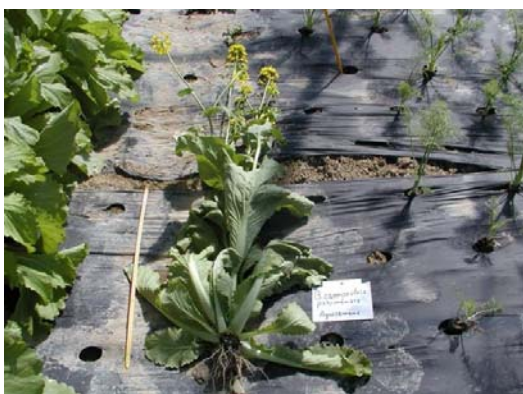
B. campestris (Agrosemens)