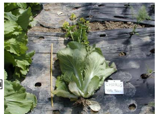
CHORUS (Voltz Takii)