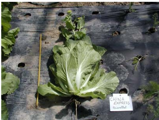
CHINA EXPRESS (Ducrettet)