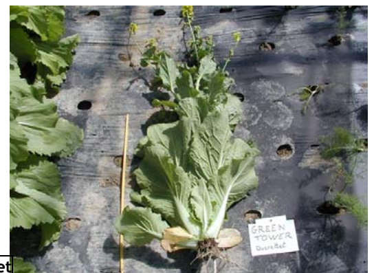
GREEN TOWER (Ducrettet)