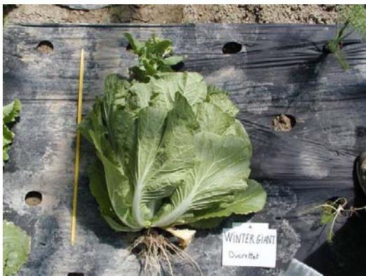
WINTER GIANT (Ducrettet)