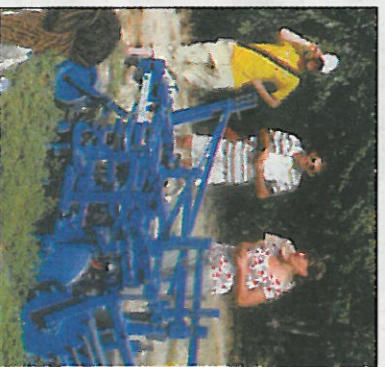
La machine MTCS, présentée à nouveau pour le travail du sol.