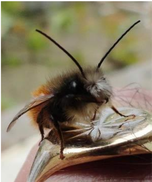
Osmia cornuta mâle