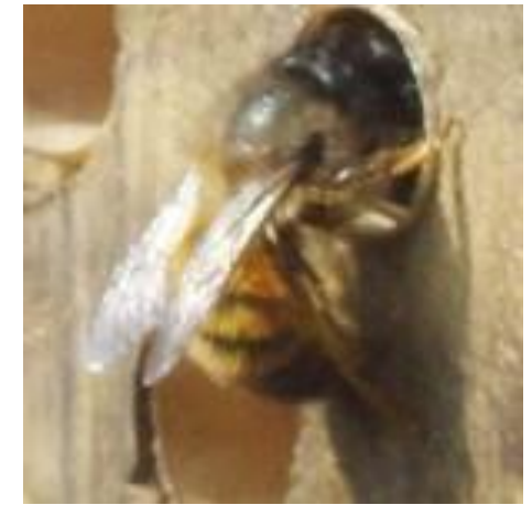
Osmia rufa - femelle