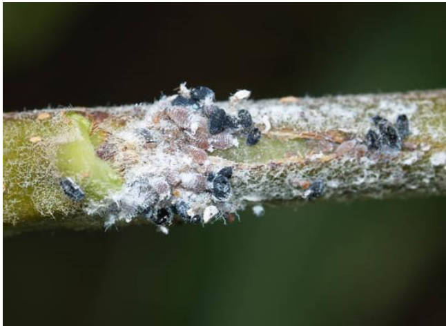
Parasitisme de puceron lanigères par Aphénilus mali