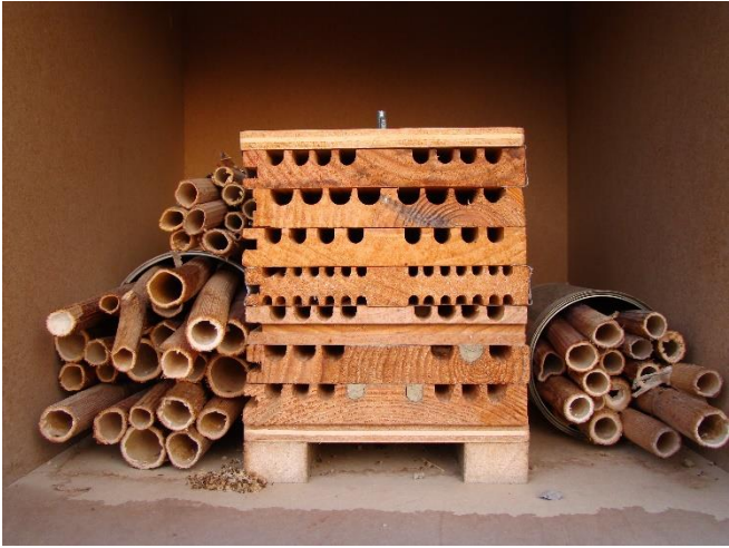
Abris pour abeilles sauvages