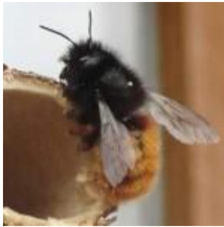
Osmia cornuta - femelle