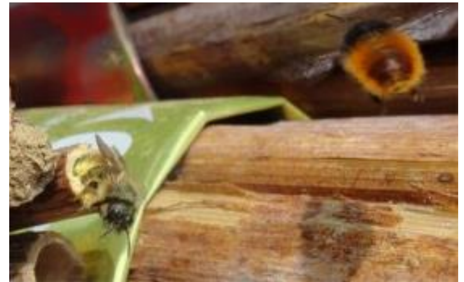
Osmia rufa (à gauche) et Osmia cornuta (à droite)