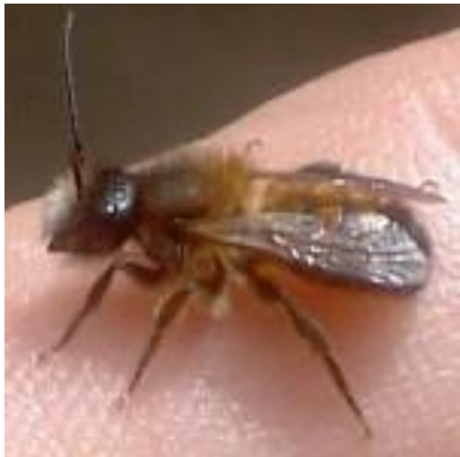
Osmia rufa mâle – plus petit avec le nez blanc