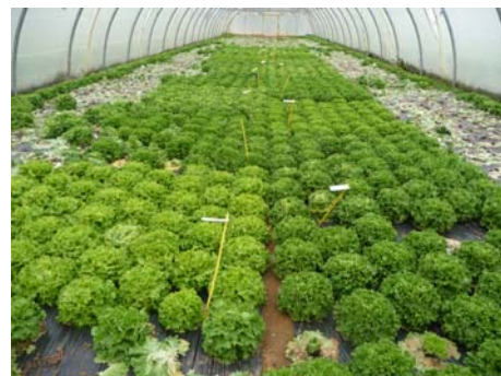
La culture à la récolte