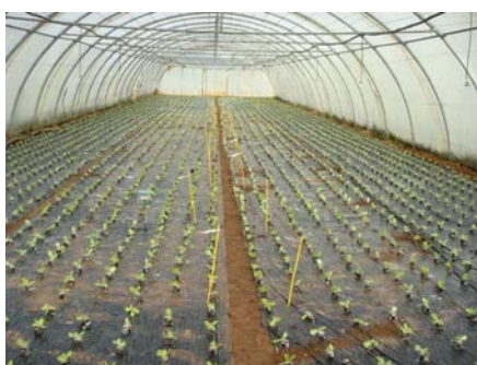
La culture à la plantation