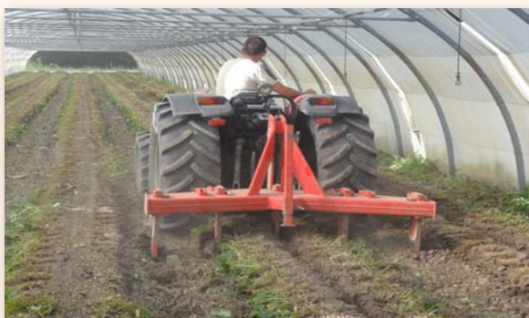
Passage d'une sous-soleuse

Il est réalisé comme pour une plantation ou un semis. Il a pour but d'obtenir un sol bien préparé sur 25 à 30 cm de profondeur, avec une structure fine et régulière : passage de sous-soleuse, rotobèche, rotavator ou herse rotative.