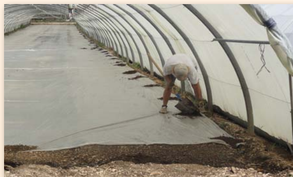
Mise en place du paillage

- On peut aussi dérouler le film de paillage après l'aspersion. Cette opération réalisée sur un sol détrempe est plus ou moins aisée.