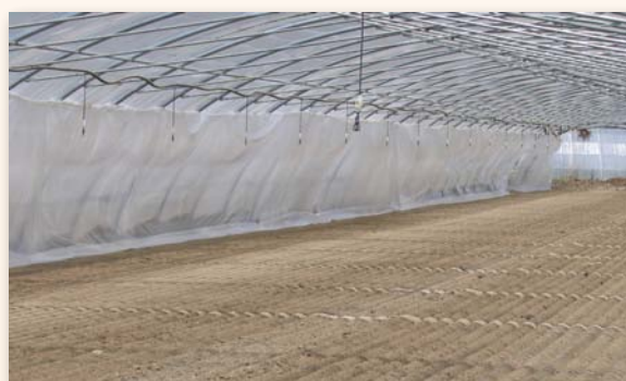
Mise en place du paillage avant l'aspersion

- Avant l'aspersion, enterrer le film de paillage le long d'une bordure du tunnel, le tenir coincé jusqu'au fil de fer situé à 1,50 m de hauteur environ.