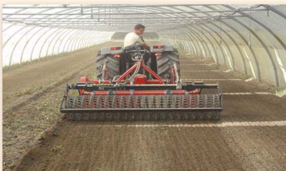
Passage d'un rouleau enfouisseur de pierres

En dernière opération, le passage d'un rouleau est indispensable pour aplanir le sol et avoir le meilleur contact possible entre le sol et le paillage plastique, garantissant une bonne conduction de la chaleur.