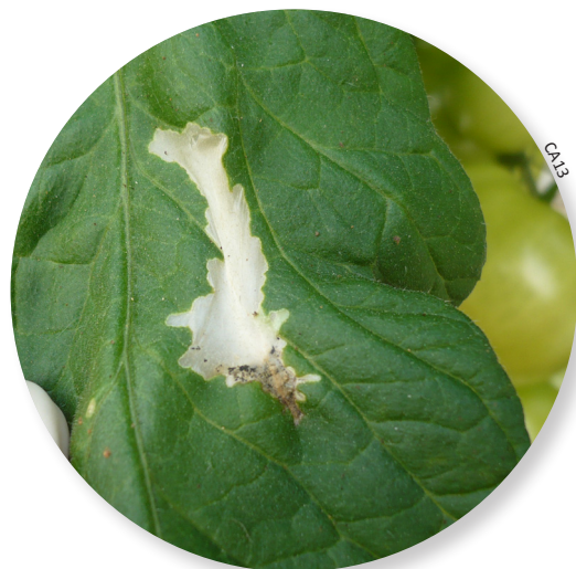
Mine de Tuta sur feuille

Les larves de Tuta creusent des mines dans les feuilles, les tiges et dans les fruits. Sur feuilles, les galeries sont beaucoup plus larges que celles des mouches mineuses Liriomyza . Sur fruits, les mines sont superficielles, souvent sous les sépales. Une larve peut créer plusieurs mines sur plusieurs folioles ou sur plusieurs fruits.