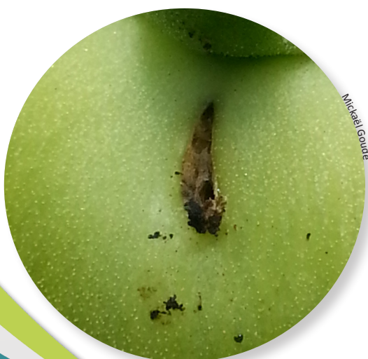
Dégâts de Tuta sur fruit vert