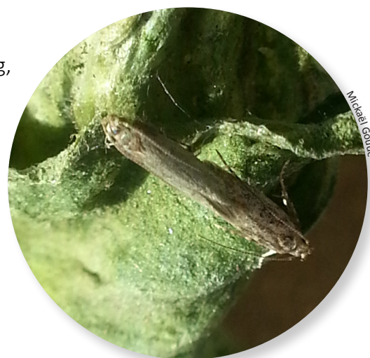
Accouplement de Tuta

Les adultes sont des papillons d'environ 5 à 7 mm de long, de couleur grise avec des taches marron sur les ailes et des antennes assez longues. Ils sont plutôt actifs à l'aube et au crépuscule. Les œufs, minuscules, sont pondus de façon isolée. Les larves sont des chenilles de 0,6 à 8 mm de long. Elles ont 5 paires de fausses pattes. D'abord de couleur crème puis verdâtres, elles vivent dans des mines dans l'épaisseur des feuilles et peuvent aussi creuser des galeries superficielles dans les fruits. La nymphose a lieu dans la feuille (chrysalide brune dans la mine) ou au sol.