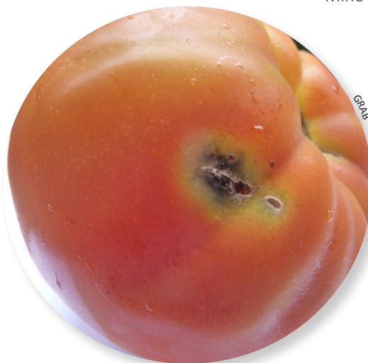
Dégâts de Tuta sur fruit rouge