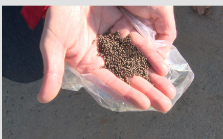
4. Seme di cavolfiore.