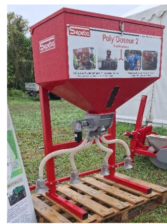
Semoir « à la volée »