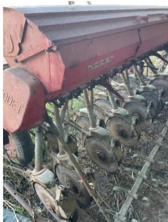
Semoir à disques

Nota bene : il existe des semoirs maraîchers manuels, adaptés pour de petites surfaces ou pour un travail en planche.